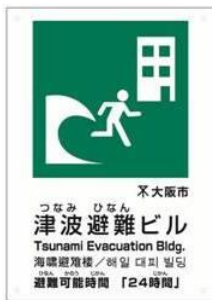
▲津波避難ビル マーク