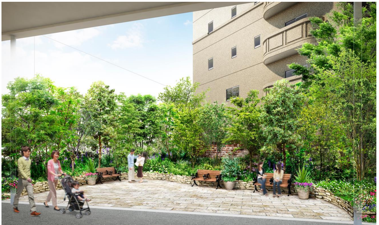
▲「ポケットパーク」完成予想CG