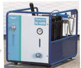
▲災害対策用 小型造水機 (参考写真)