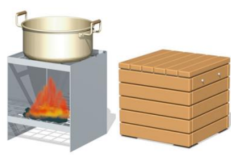
▲かまどスツール (参考写真)