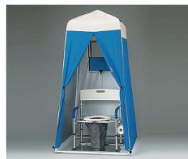
▲災害用マンホールトイレ (参考写真)