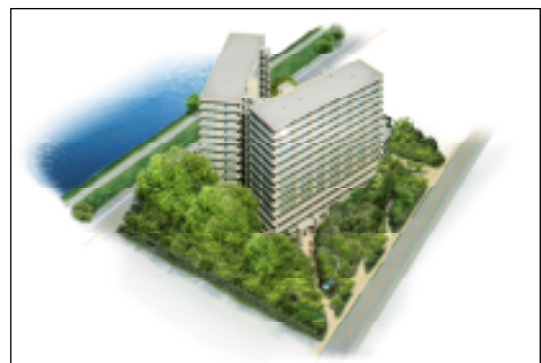
梅田・新大阪ともに30分圏内という好立地に位置

販売を予定している住戸プランは以下のとおりで、平均専有面積は80㎡超。共働きのご夫妻からお子さまのいらっしゃるご家