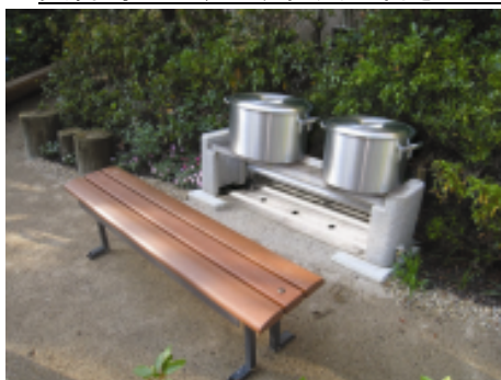
普段はベンチ、災害時には「かまど」として使用できる「かまどベンチ」

耐震性・耐火性に優れた構造を持ち、建物内部や避難時の安全性基準を満たし、さらに災害があった場合にも生活できる性能(かまどベンチ・災害用マンホールトイレなど)を備えていることから、「大阪市防災力強化マンション」にも認定される予定です。万が一の災害時には、マンション住民だけでなく、近隣住民のみならず「かまどベンチ」や「災害用マンホールトイレ」、救急救命用品なども、近隣住民の皆さまに使用していただきます。