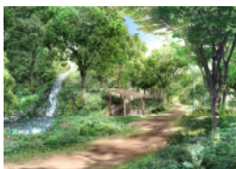
「ユニバーサルパス」

敷地面積およそ8,200㎡の50%近くにあたる約4,000㎡に、樹木約17,200本、草花約21,500株を植えて森に。12m高の山も配され、さらには12mもの巨木を植えることで、緑地表面積を高めています(山に巨木を植えると、マンション8階相当の高さに)。