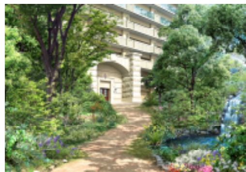
最新の環境対策設備も充実

紫外線を70%以上カットするペアガラスを装備し、外壁にサーモシャット工法を採用。そのうえお湯が冷めにくい「魔法びん浴槽」を配置した省エネ住戸を、13階から15階の計42戸に導入します。省エネ住戸においては年間4万円以上の光熱費削減が期待できます。