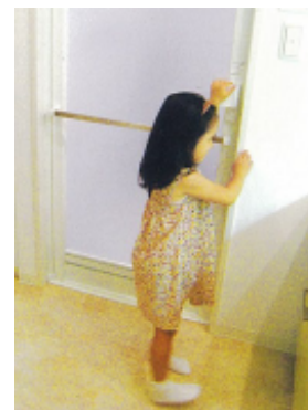
浴室にはチャイルドロック機能付き

リビングを中心とした回遊性を重視した間取りは、懐かしい居間の“ちゃぶ台”の心を活かして、家族全員が集うリビング空間を重視した設計です。また急な開閉を抑えるドアクローザーや、浴室へ小児が入るのを防ぐチャイルドロック機能付き浴室扉、指挟み防止加工を施した玄関扉など、お子さまの目線に立った行き届いた仕様になっています。